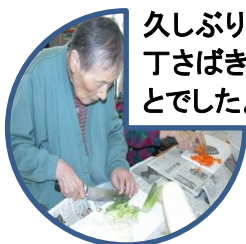
久しぶりの包丁さばき、みごとでした。