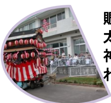
賑やかな笛や太鼓、そしてお神酒もふるまわれました。