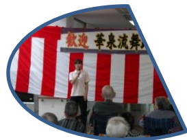
華泉流の方の優雅な舞。そして代表の入所者の方から花束の贈呈を行いました。