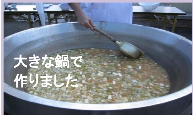
大きな鍋で作りました